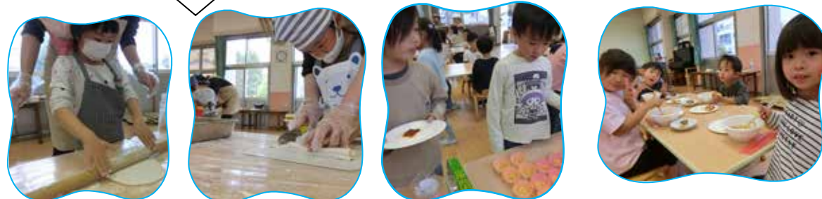
⑤夕飯作り うどんの生地はーからこねて切って、ピザの材料は切って乗っけて楽しかったね☆