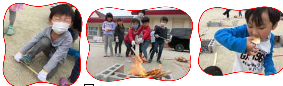
④火起こし体験！自分たちで木をくべ、火をつけ、焼きマシュマロ♡