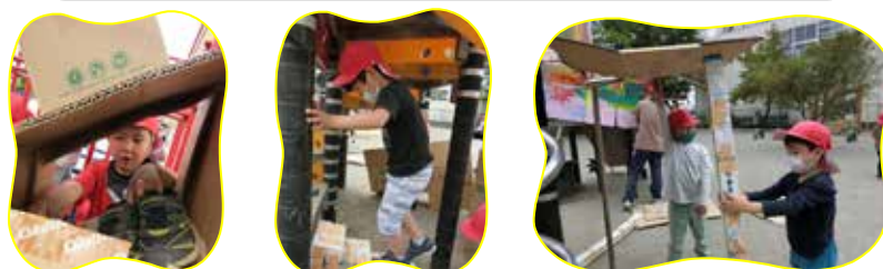
①グループ毎に分かれ、設計図を書いたり、事前準備をして、いざ組み立て！思い思いに工夫した秘密基地が完成☆彡

5/7にゆり組が「森のほいくえん」を行いました。本来であれば、赤城青年の家に行きお泊り保育をする予定でしたが、昨年度よりコロナ禍のため講師の方を園にお招きし、園内で出来る体験を朝から夜8時まで行いました。当日に向け、子どもたちと意見を出し合い、行いたい活動を決めました。当日は、①段ボールでの秘密基地作り②お弁当を詰めランチタイム③空中アスレチック④火起こし体験(マシュマロのおやつ)⑤夕飯作り(うどん・ピザ)⑥夜のお楽しみと盛りだくさんの体験を味わうことが出来たようです♡